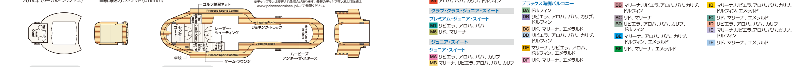
Sky スカイ・デッキ19 Sports スポーツ・デッキ18