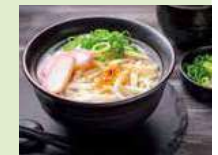
讃岐うどん(イメージ)

香川県を代表する名物讃岐うどん。コシの強い麺と味わい深いいりこ出汁が特徴です。その味を存分に届けたいと、うどん屋さんを貸切ります。ぜひ食べに“おいでまい”。