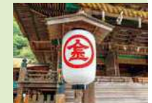
金刀比羅宮の提灯

お座敷唄から今や香川の民謡に。軽快なリズムにのせた歌詞は誰もが知るころ。唄の題材となった金刀比羅宮は、海上守護や五穀豊穡、金運のご利益があるとされています。今年の無事と来年の幸せをお祈りしましょう。