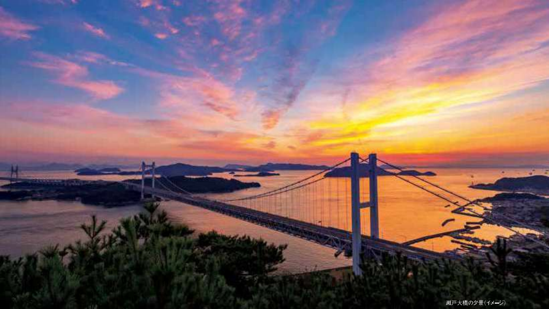
瀬戸大橋の夕景(イメージ)