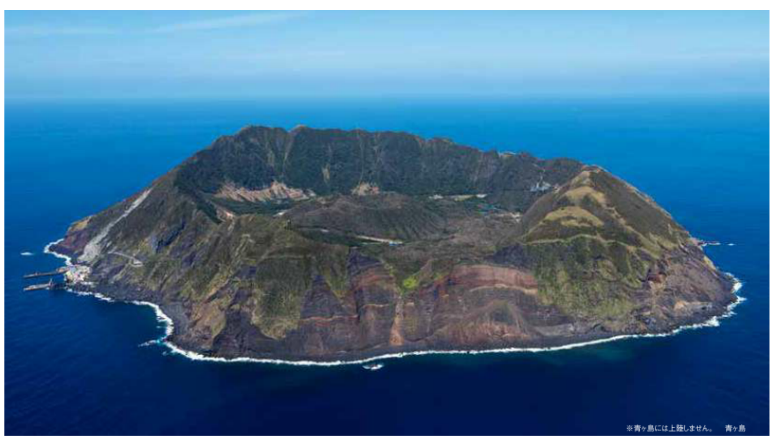
※青ヶ島には上陸しません。 青ヶ島