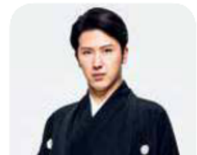
尾上 松也 【歌舞伎俳優】

1990年5月、「伽羅先代萩」の鶴千代役にて、二代目尾上松也を名のり初舞台。近年は立役として注目され、「弁天娘女男白浪」の弁天小僧菊之助などの大役を任されている。