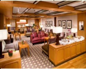
↑ネプチューンラウンジ 詳細はこちら